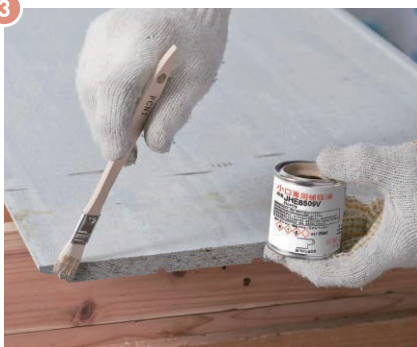
▲モエン切断小口面を補修塗装する