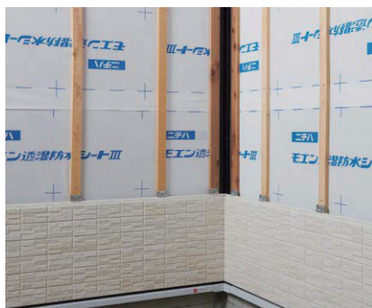
▲留付金具EXであと施工モエンを施工する