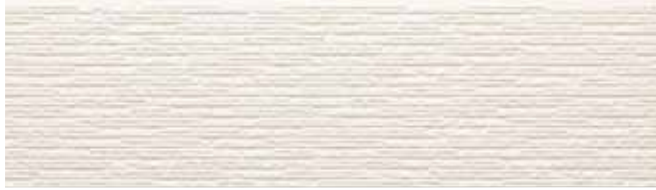
EF9051G プラムMGホワイト EF9051

やわらかな光と影をつくる繊細な石積み柄。 クラフト感のある繊細なラインが、住宅を上品に仕上げます。