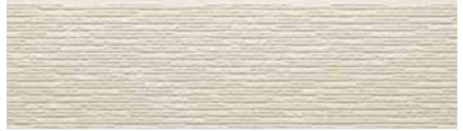
EF9052G プラムMGアイボリー EF9052