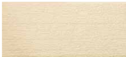
EF5358G プラムMGクリーム EF5353G