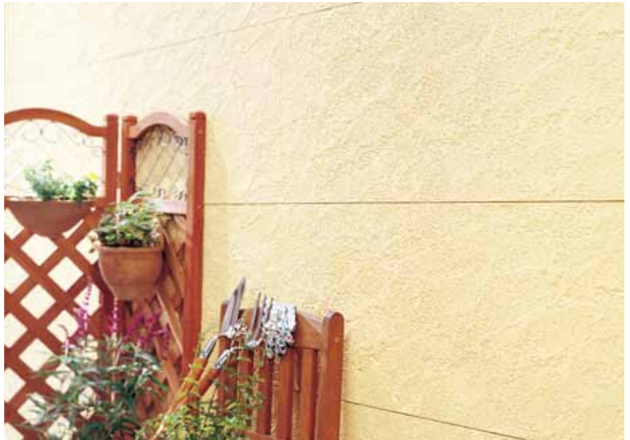
EF1253G (EF1253) イメージ