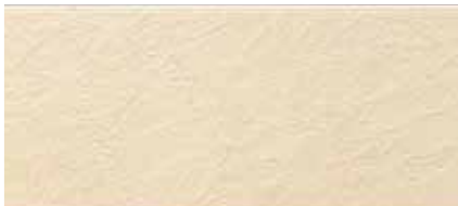
EF1256G プラムMGクリーム EF1256