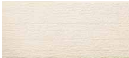
EF5357G プラムMGアッシュ EF5352G