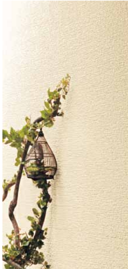
EF5358G (EF5353G) イメージ