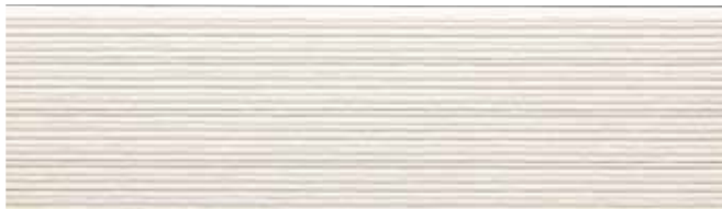
EFX3751G プラムMGホワイト EFX3751