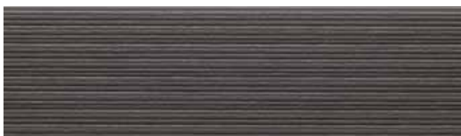
EFX3754G プラムMGチャコール EFX3754