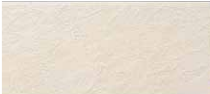
EF1255G プラムMGアッシュ EF1255