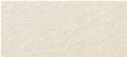
EF1252G プラムMGアイボリー EF1252