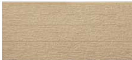
EF5359G プラムMGブラウン EF5354G