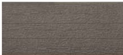
EF5360G プラムMGセピア EF5355G