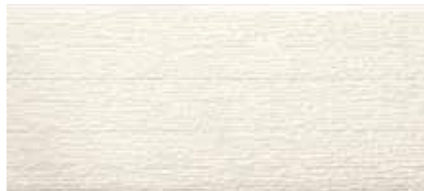
EF5356G プラムMGバニラホワイト EF5351G

上下の継ぎ目が目立ちにくい一体感のあるデザイン。 職人技で仕上げたようなこまやかな素材感が、ゆったりと上質な印象を醸し出します。