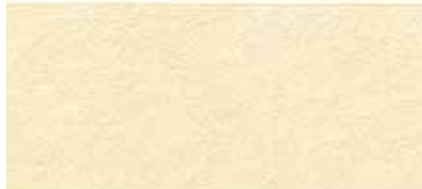
EF1253G プラムMGリモーネ EF1253