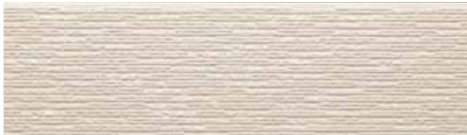
EF9053G プラムMGアッシュ EF9053