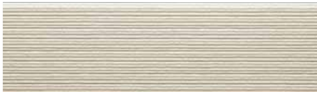
EFX3752G プラムMGアイボリー EFX3752