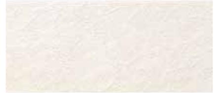
EF1254G プラムMGホワイト EF1254