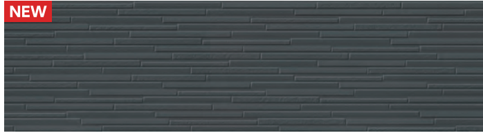
MFX907C リーブMGディープブルー