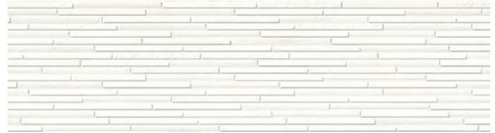
MFX901C リーブMGクリアホワイト