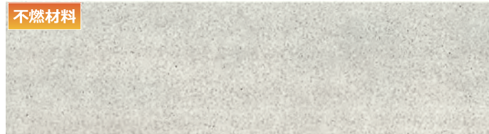
EQS501E グラニットNMホワイト