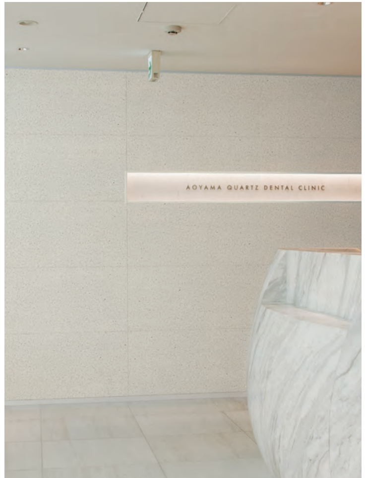
グラニットホワイト/写真はイメージです