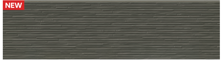
EPS528EK パティMGモスグリーン ※1