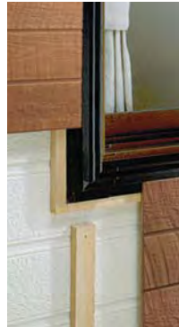
開口部材デラックスタイプ施工イメージ

窓廻りをスッキリと美しく仕上げるために、開発された差し込み式の開口部材。既存のサッシを生かし、簡単な取り付けでモエンの切断端部をきれいに納め、シーリングの必要がなくなる（開口額縁18・30は除く）高い意匠性が開口部を引き立たせます。