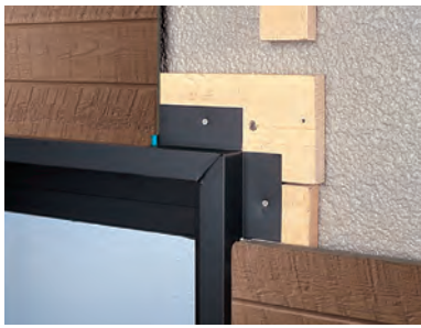
開口額縁18<上左右用> (JKB7188UY)