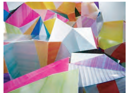
『August』2008年 プラスティック、インク サイズ可変 児玉画廊/東京

『Reverse Taper's Portrait』2009年「逆テーパの肖像」椰子、テーブル、ファン、ボール、ストーブ、ビーチチェア、木、段ボール、ホース、スプリンクラー ベルリン/ドイツ