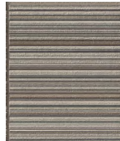
外壁材 モエンエクセラードI6 Fu-ge ラトワール ラトワールブラチナE