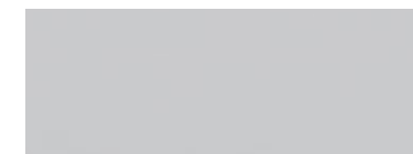
外壁材 COOL メモリア ライトグレー