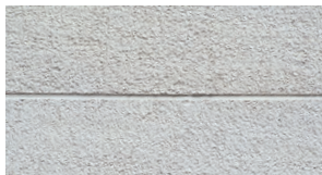
化粧目地の施工例

（※1）鉄骨造：C形鋼75×45×厚み1.6mm以上（縦組み、横組み@606mm以下）の上に木胴縁33mm厚の直交組みとなります。