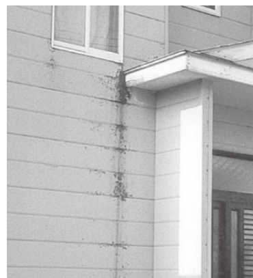
【屋根から伝わる雨だれ】