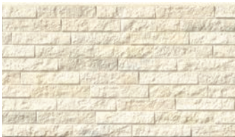
EFF5721E ミラベルMGクリアホワイトE

大理石の割石をモチーフにしました。ナチュラルな陰影感とうねりの中にもアーバンモダンな高級感を醸し出します。