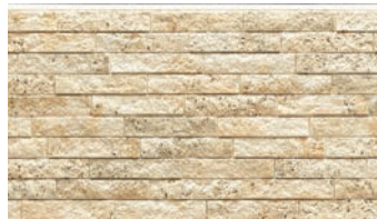
EFF5722E ミラベルMGベージュE