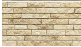
EFF5822E グラナダMGイエローE