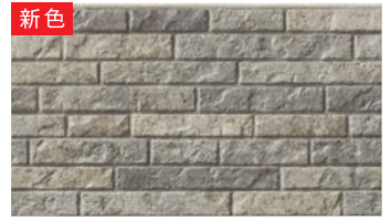
EFF5824E グラナダMGブラックE