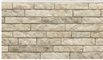
EFF5821E グラナダMGホワイトE

上質なワイナリーのような醸成感をイメージ。時を経た歴史的の風格を感じさせる壁面は、コックリとまろやかに彩ります。