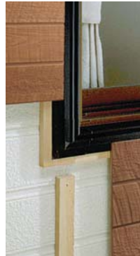
開口部材デラックスタイプ施工イメージ

窓廻りをスッキリと美しく仕上げるために、開発された差し込み式の開口部材。既存のサッシを生かし、簡単な取り付けでモエンの切断端部をきれいに納め、シーリングの必要がなくなる（開口額縁18・30は除く）高い意匠性が開口部を引き立たせます。