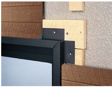
開口額縁18(上左右用) (JKB7188UY)