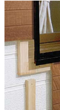
開口部材スタンダードタイプ施工イメージ